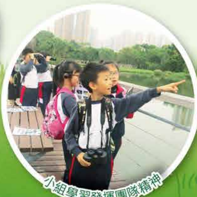
小組學習發揮團隊精神