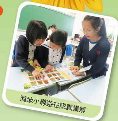
濕地小導遊在認真講解

課程已推展至五年級，在常識相關課題滲入濕地知識，其他科目如中文、英文、數學、視覺藝術、音樂等也進行相關學習活動，趣味盎然。