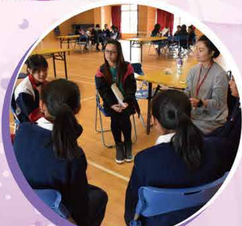
家長義工協助小六升中模擬面試