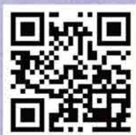
元朗公立中學校友會 鄧英業小學網址 QR Code