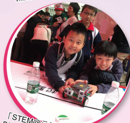
「STEM@元朗2019創新至叻兵團BDS機械人避障友誼賽」冠軍