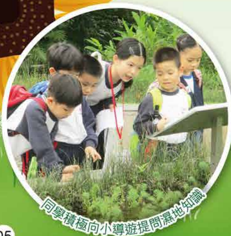
同學積極向小導遊提問濕地知識

我們深信孩子自小在心田埋下愛護濕地、愛護大自然的種子，將來這班「濕地小博士」會將所學帶到社會，延續對大地之感恩。