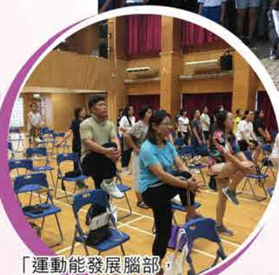
「運動能發展腦部，促進學生學習」家長講座