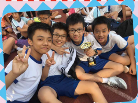
元朗區小學校際田徑比賽