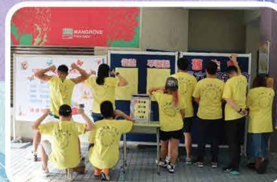
舊生會幹事會選舉