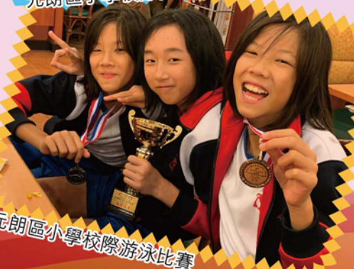
元朗區小學校際游泳比賽