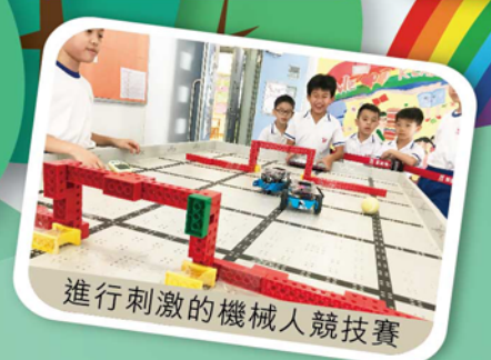
進行刺激的機械人競技賽