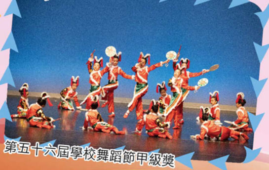
第五十六屆學校舞蹈節甲級獎