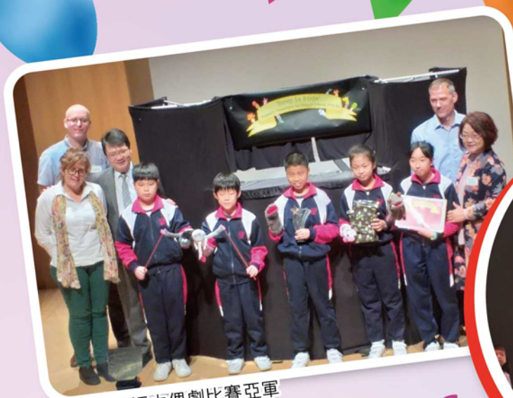
教育局英語木偶劇比賽亞軍