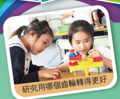
研究用哪個齒輪轉得更好