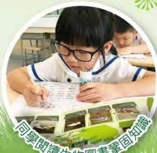
同學閱讀生物圖書鞏固知識