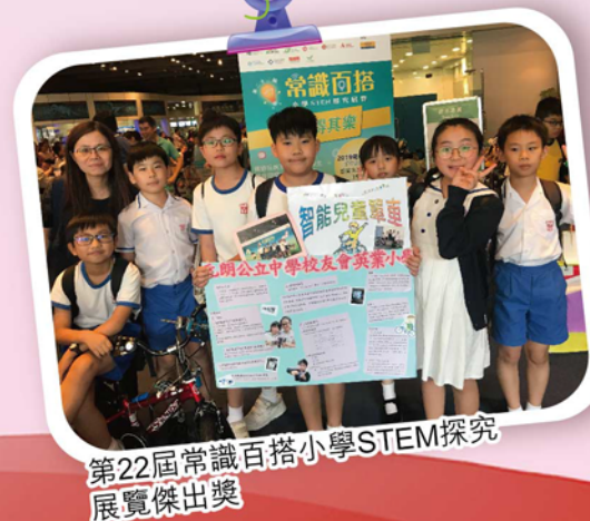
第22屆常識百搭小學STEM探究展覽傑出獎