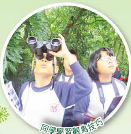
同學學習觀鳥技巧