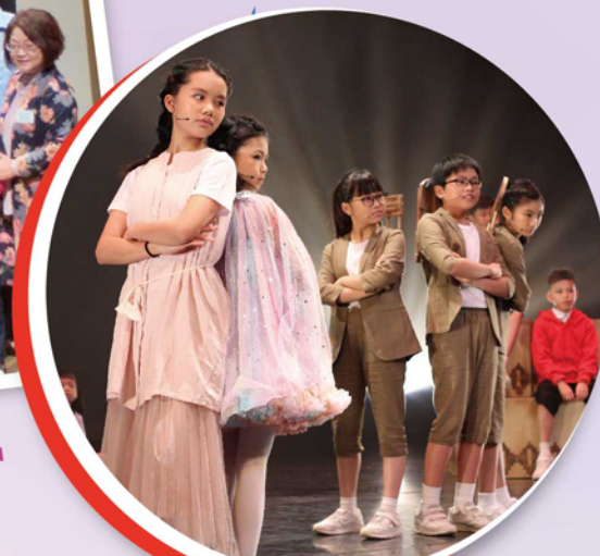
《反斗道具奇兵》英語音樂劇