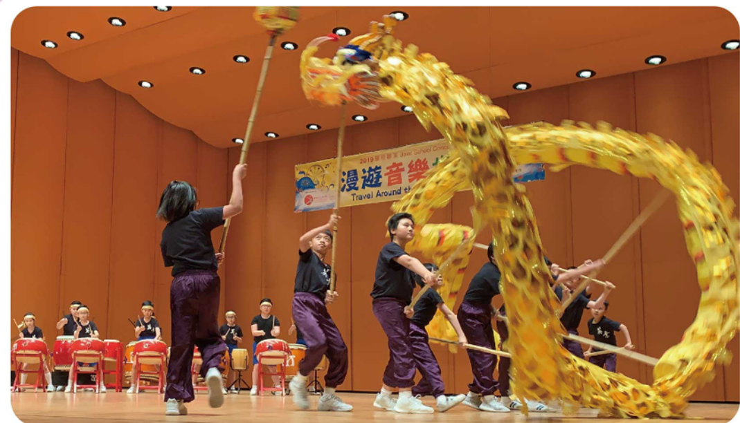
音樂事務處漫遊音樂世界-學校聯演優良表演獎