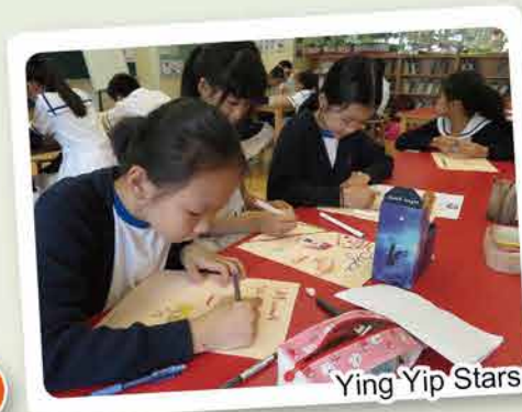
Ying Yip Stars