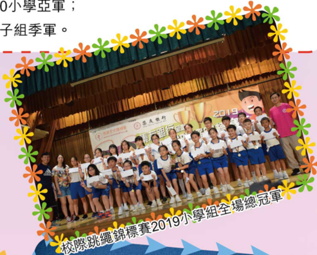
校際跳繩錦標賽2019小學組全場總冠軍