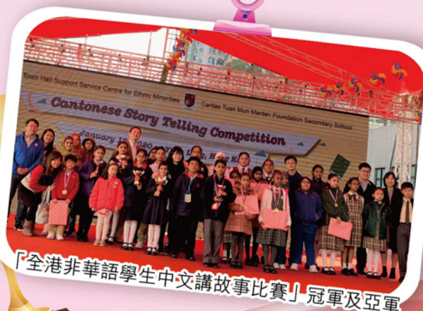
「全港非華語學生中文講故事比賽」冠軍及亞軍