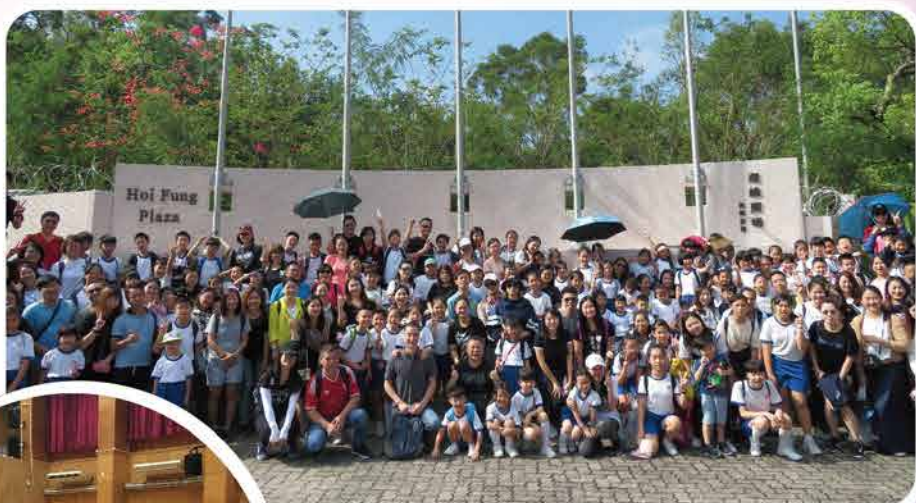
家教會親子一日遊

家教會一直是學校活動的強大後援。除了恆常性的義工活動外，每年的重點活動包括親子一日遊、聖誕聯歡會、親子羽毛球比賽及不同類型的家長興趣班。