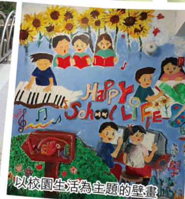
以校園生活為主題的壁畫