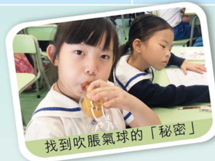
找到吹脹氣球的「秘密」